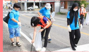
あいホーム石岡の利用者様が クリーンアップ作戦に 参加しました！